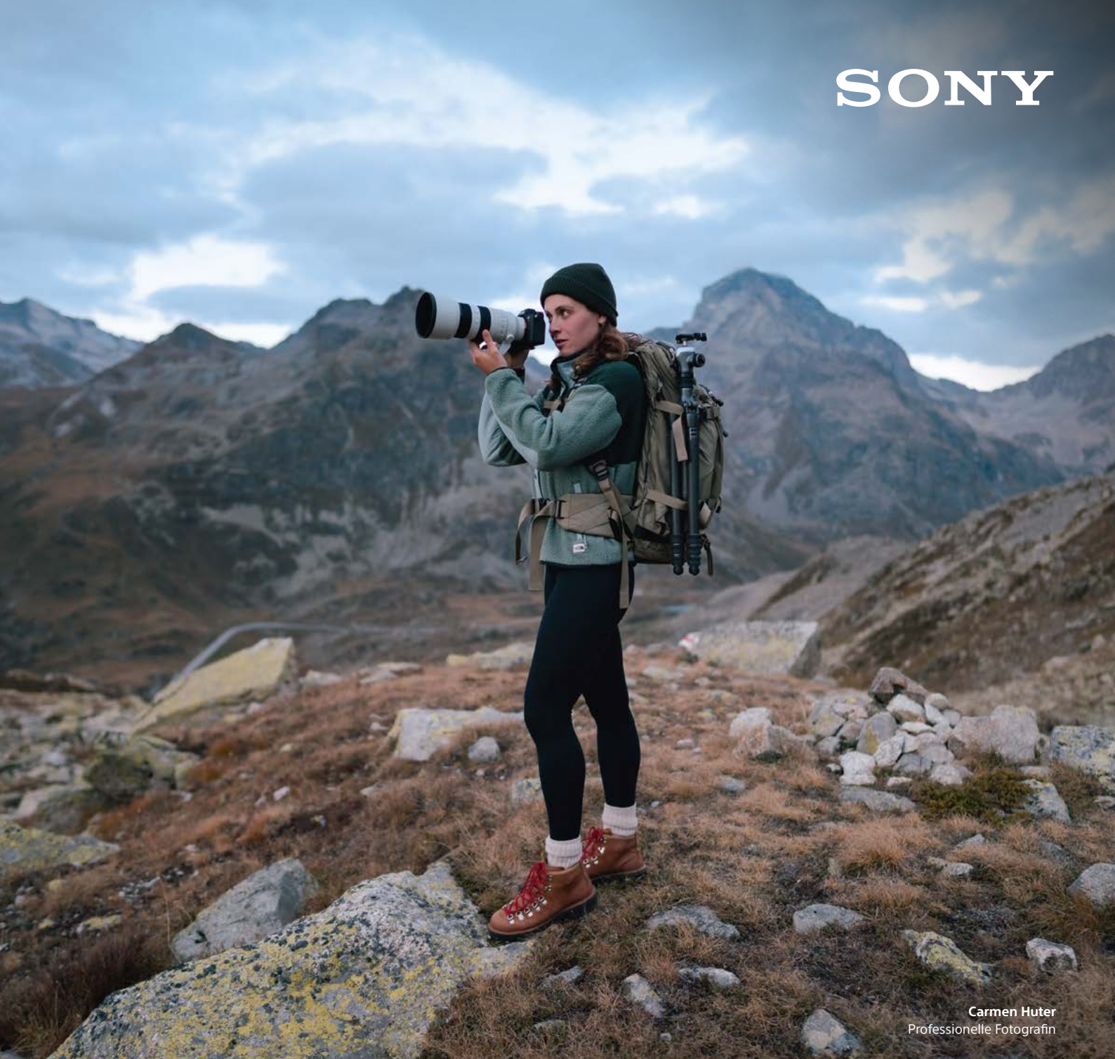
Carmen Huter Professionelle Fotografin