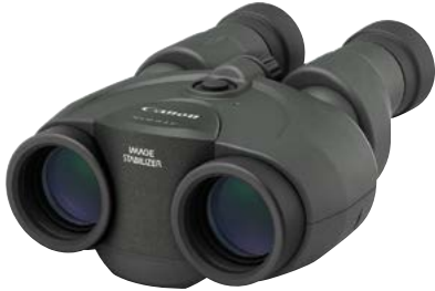
Canon 10x30 IS II