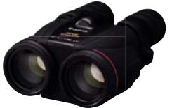
Canon 10x42 L IS WP