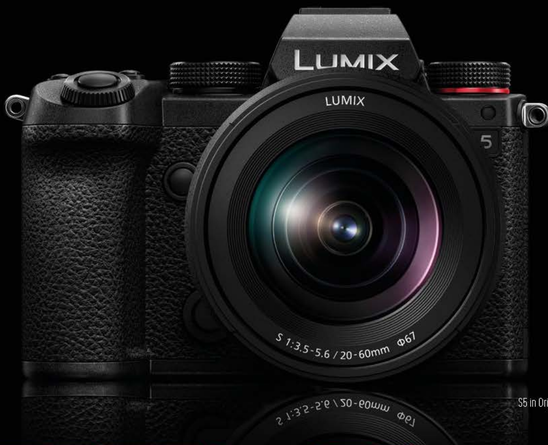
S5 in Originalgröße