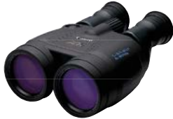
Canon 15x50 IS AW